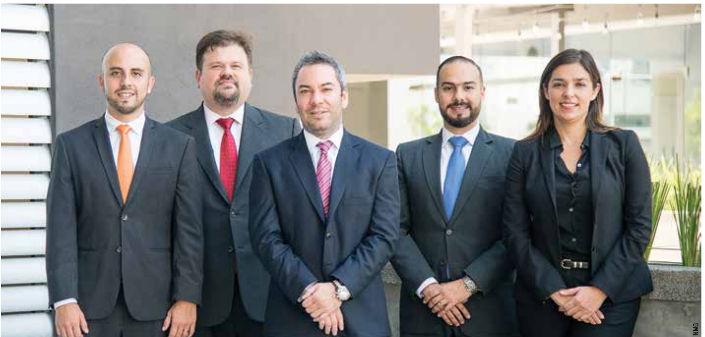
En la foto el equipo de socios de Costa Rica.

Arias ofrece servicios legales en más de 30 áreas de práctica. Las que tienen mayor demanda son el derecho corporativo, fusiones y adquisiciones, derecho bancario y financiero, propiedad intelectual, litigio y resolución de disputas, derecho laboral,